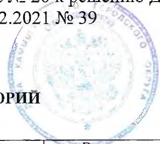
СХЕМА ГРАНИЦ ПРИЛЕГАЮЩИХ ТЕРРИТОРИЙ